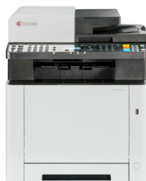
Die vier neuen A4-Farbdrucker und Multifunktionsgeräte von Kyocera eignen sich speziell für kleine Teams und den Einsatz im Homeoffice.

sparung für eine gleichmäßigere Lichtreflektion. Eine optimierte Farbtabelle und -abstimmung ermöglichte zudem vor allem beim Druck von Blautönen lebendigere Farben. Auch die Scanfunktion ist mit bis zu 30 Bildern pro Sekunde (schwarzweiß) auf Geschwindigkeit ausgelegt. Eine neue Bildverarbeitungstechnologie soll insbesondere Hautfarben natürlicher wiedergeben können. Auch bei den neuen Systemen setzt Kyocera auf Nachhaltigkeit, beispielsweise durch die eingebaute Duplex-Einheit. Der Arbeitsplatz der Zukunft wird vor allem durch ein Mehr an Flexibilität bestimmt. Die neuen Systeme bieten daher Funktio-